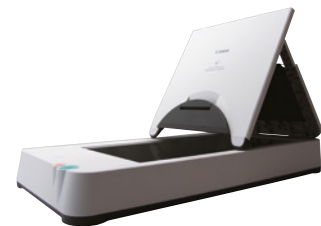
Flatbäddsscanner (A4) 101